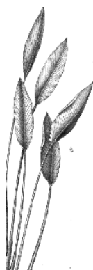
Rajska ptica (list)

Cvjetna stapka ruža nije uvijek sasvim uspravna, zbog toga se prilikom aranžiranja ružu treba postaviti onako kako najbolje odgovara cvijetu, tj. malo postrance kako